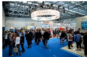
DGS Jahrestagung Stuttgart 2018